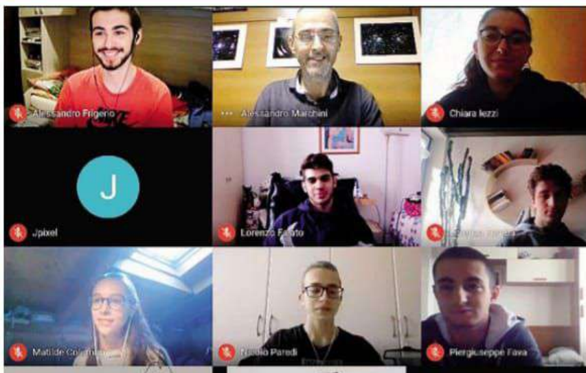
Una delle iniziative online del liceo Galilei, che testa periodicamente la propria offerta formativa ARCHIVIO